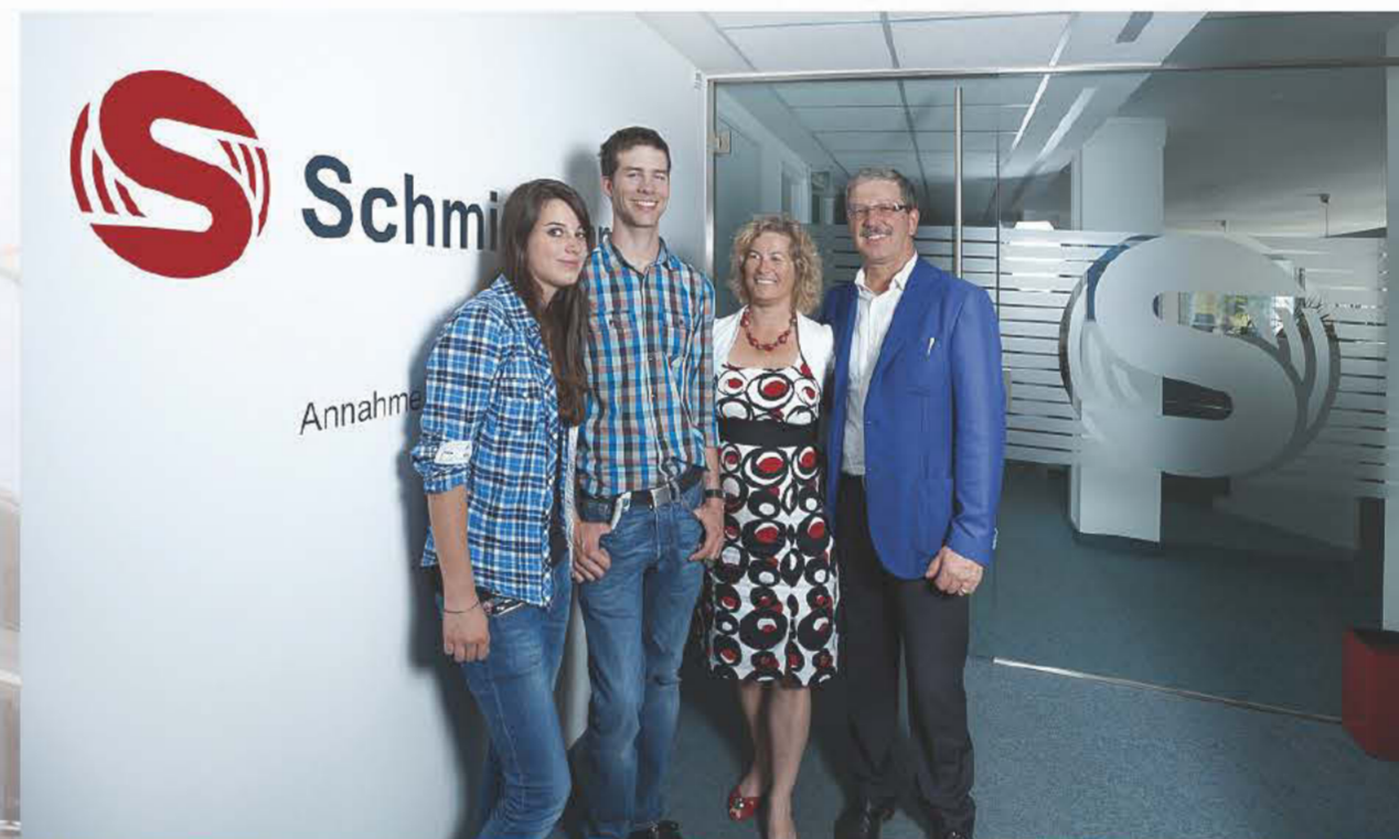
Erfolgreicher Familienbetrieb auf dem Weg in die 3. Generation

rücksichtigung sämtlicher Umweltauflagen, realisiert. J. Schmidhammer GmbH ist ein Familienbetrieb mit Sinn für Nachhaltigkeit und Wertschätzung der menschlichen Ressourcen, der sich bereits in der angehenden dritten Generation befindet.