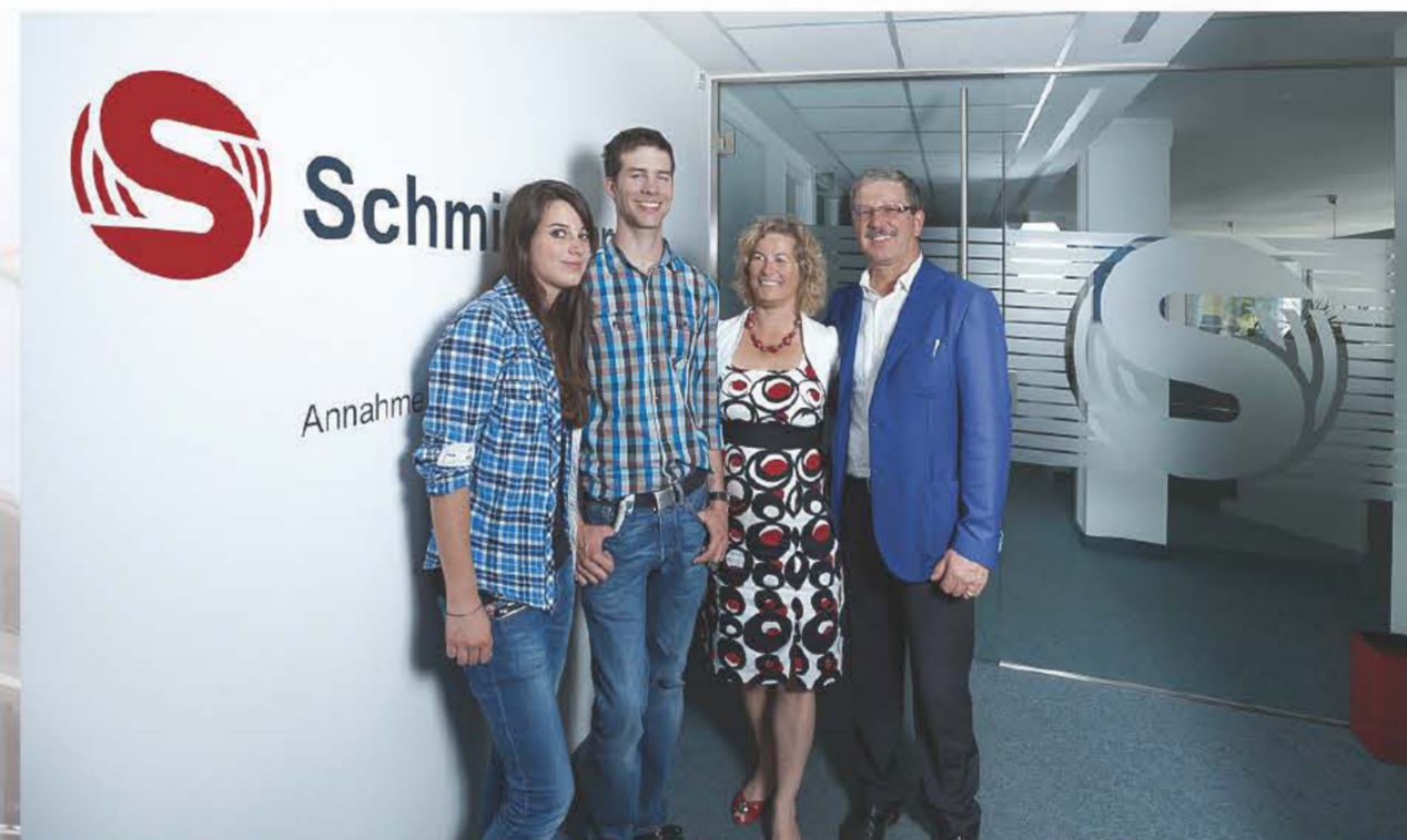
Erfolgreicher Familienbetrieb auf dem Weg in die 3. Generation

nen unmittelbaren Mehrwert für den Kunden dar. Neben der klassischen Tätigkeit eines etablierten Fachbetriebes im Nebengebäude werden auch spezielle Anlagentechniken für die Industrie und die Hotellerie unter der Anwendung von innovativen Konzepten und Systemen sowie unter Berücksichtigung sämtlicher Umweltauflagen, realisiert. J. Schmidhammer GmbH ist ein Familienbetrieb mit Sinn für Nachhaltigkeit und Wertschätzung der menschlichen Ressourcen, der sich bereits in der angehenden dritten Generation befindet.