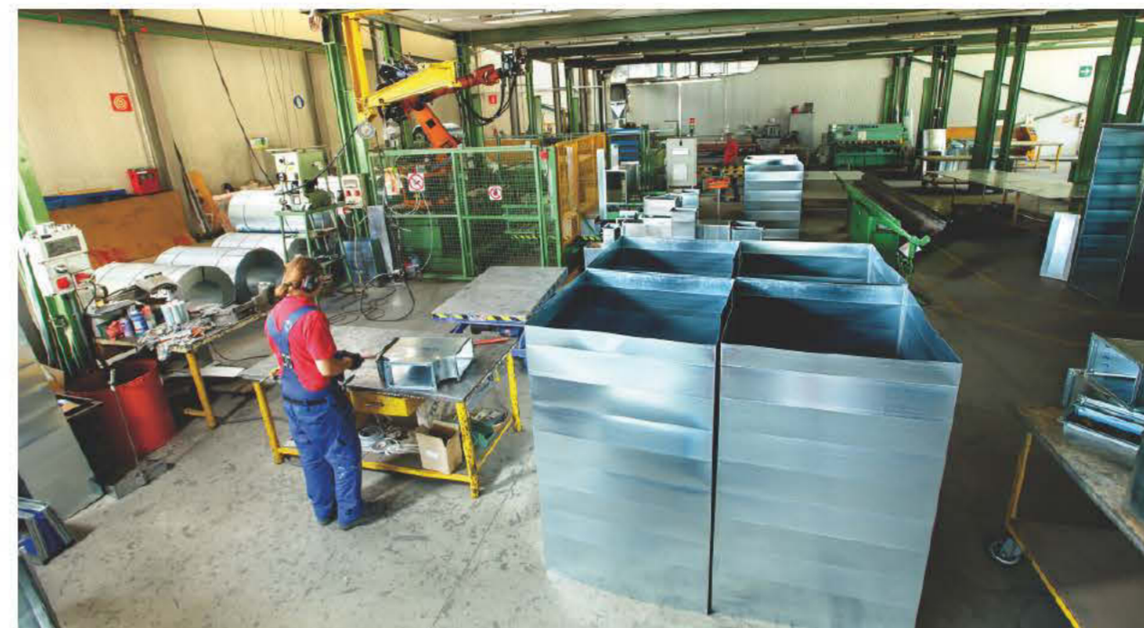
Hohe Fertigungstiefe bei Schmidhammer: Die meisten Bauteile werden auf modernsten Anlagen im Hause hergestellt

Familienunternehmen mit Sinn für Nachhaltigkeit und Wertschätzung der menschlichen Ressourcen auf dem Weg in die dritte Generation.